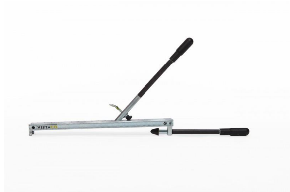
Outil VistaBond HP (Outil pour percer les trous)