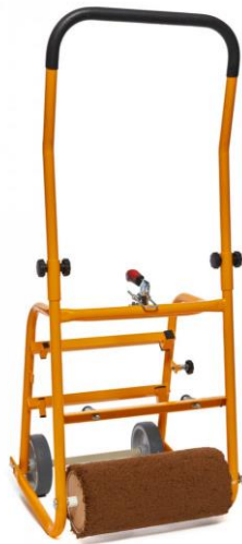
VistaBond Spreader 14" rouleaux de 14" (35 cm)

Comme alternative au BetterSpreader, il est maintenant possible d'utiliser la nouvelle version (Européenne), le VistaBond Spreader, pour une mise en œuvre aisée de la colle BA-2012 de Firestone. Le VistaBond possède les mêmes avantages que les autres outils Spreader (écoulement gravitaire, haut taux de couverture, léger, facile à utiliser) 1 mais est également conçu pour un maintien idéal des bidons de 20 L de BA-2012. VistaBond Spreader est disponible en une taille unique et son fabricant a également développé un outil pour le perçage des trous pour une plus grande sécurité et facilité d'utilisation :